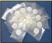
ORTHOREBIRTH株式会社 (フナコシ株式会社より販売)