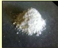
伊藤忠製糖株式会社